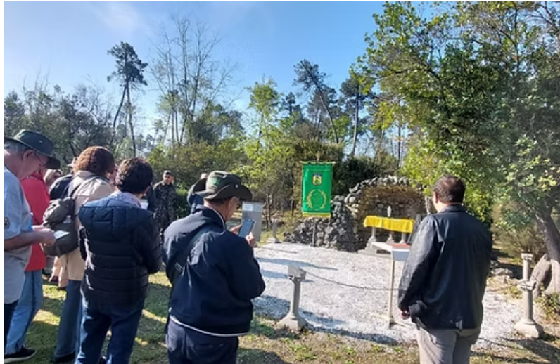
Monte Bastione - visita ao local do primeiro tiro da FEB. Visita prefeitura de Massarosa e Camaiore.