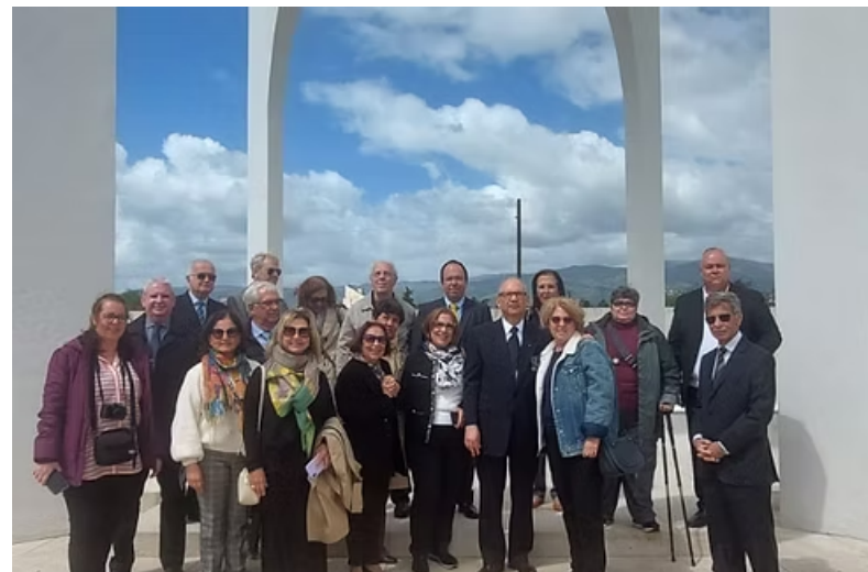
Visita a Prefeitura de Montese com cortejo ao mirante aos Monumentos aos soldados italianos e aos soldados brasileiros.