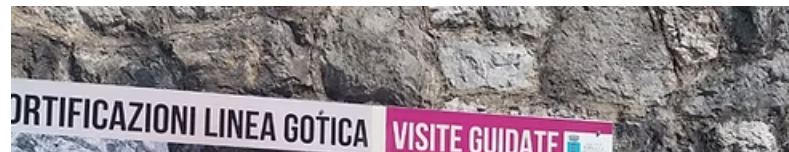
Visita ao Monumento Votivo Militar Brasileiro. Porreta Terme visita ao monumento ao Gel Mascarenhas de Moraes e ao PC da FEB.