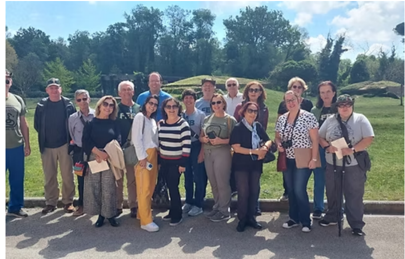
Borgo a Mozano. Visita as Linhas Góticas e ao Museu da Linha Gótica.