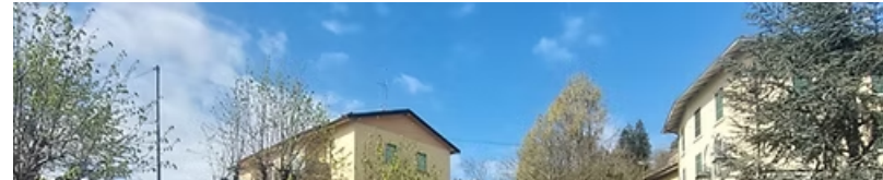
Milão - City Tour e fim dos serviços.