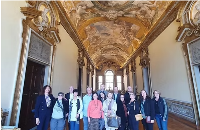
City Tour em Roma - Piazza del Campidoglio